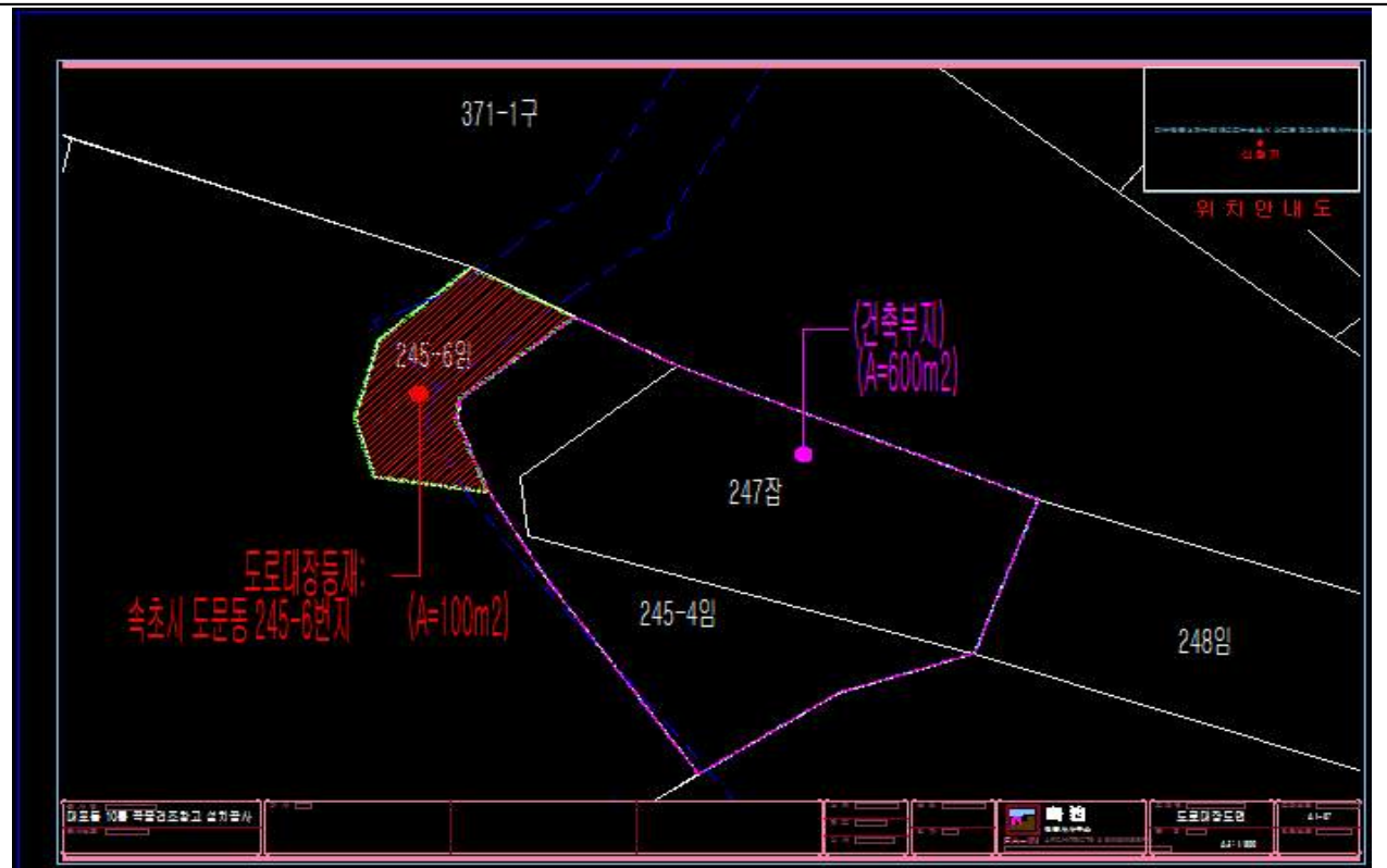
도로 지정 현황도